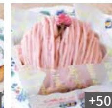
桜のモンブラン +50 Sakura Mont Blanc