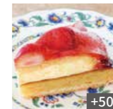
苺タルト +50 Strawberry tarts