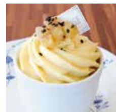
五郎島金時芋の スイートポテトプリン Sweet potato pudding