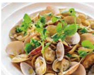
たっぷりアサリとクレソンのボンゴレビアンコ