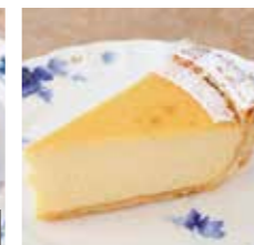
濃厚バイクドチーズ ケーキ Baked cheese cake