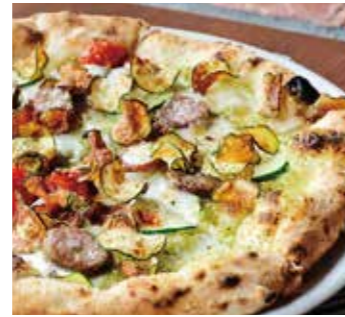
旬野菜のきまぐれピザ Capricious pizza with seasonal vegetables (旬野菜 / サルシッチャ / モッツァレラ) (seasonal vegetables / salsiccia / mozzarella)