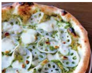
金澤ピッツァ 加賀蓮根