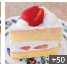
苺のスペシャル ショート +50 Strawberry short cake