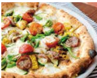
旬野菜のきまぐれピザ