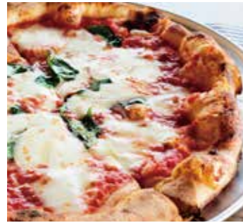
自慢のマルゲリータ Margherita (トマトソース / バジル / モッツァレラ) (tomato sauce / basil / mozzarella)