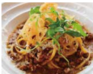
加賀蓮根と能登牛のボロネーゼ