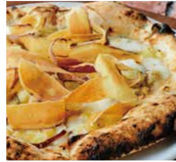
五郎島金時 "Gorojima Kintoki" Sweet potato (さつまいも / ゴルゴンゾーラ / モッツァレラ / グラナパダーノ / 金沢蜂蜜) (Sweet Potato / Gorgonzola / Mozzarella / Grana Padano / Kanazawa Honey)