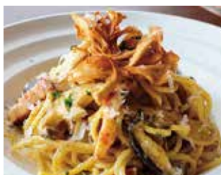
地物 3 種キノコと濃厚能登鶏卵の カルボナーラ

● 加賀蓮根と能登牛のボロネーゼ +200 Kaga lotus root and Noto beef bolognese