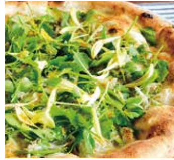
金澤せり×しらす Kanazawa Japanese parsley, whitebait (金澤せり / しらす / モッツァレラ / カラスミ) (Kanazawa Japanese parsley / whitebait / mozzarella / dried mullet roe)