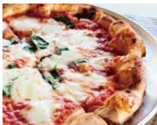
自慢のマルゲリータ