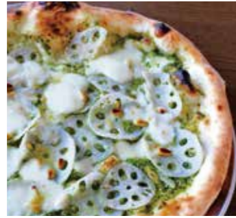
加賀蓮根 Kaga lotus root (ジェノベーゼ / 蓮根 / モッツァレラ / グラナパダーノ / 松の実) (Genovese / Lotus root / Mozzarella / Grana padano / Pine nuts)