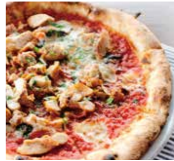
ピリ辛チキンのディアボラ Diavola (グリルチキン / トウガラシ / モッツァレラ / ガーリック / サラミ / バジル) (grilled chicken / red pepper / mozzarella / garlic / salami / basil)