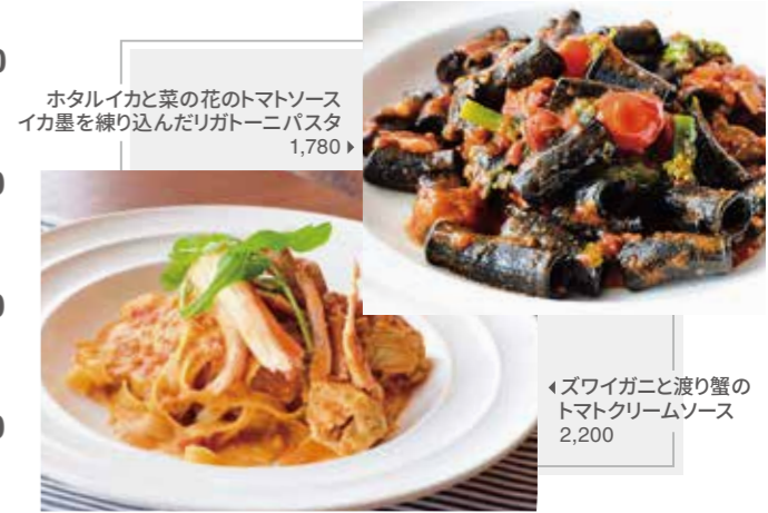
ホタルイカと菜の花のトマトソース イカ墨を練り込んだリガトーニパスタ 1,780

II ズワイガニと渡り蟹のトマトクリームソース 2,200 Tomato cream sauce with snow crab and migratory crab