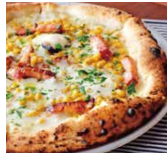
とうもろこしとベーコンの マヨコーン Corn, bacon and mayonnaise (スイートコーン / コーンソース / ベーコン / モッツァレラ) (sweet corn / corn sauce / bacon / mozzarella)

組み合わせ自由! Various combinations are available. PIZZA A + B 1,480YEN PIZZA A + C 1,580YEN PIZZA B + C 1,760YEN