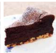
ナッツのガトー ショコラ Gateau chocolate