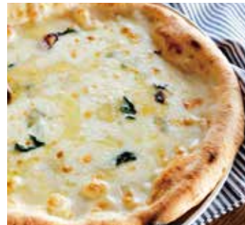
4種チーズのクアトロ フォルマッジ Quattro formaggi (バジル / タレージョ / ゴルゴンゾーラ / モッツァレラ / グラナパダーノ) (basil / taleggio / gorgonzola / mozzarella / grana padano)